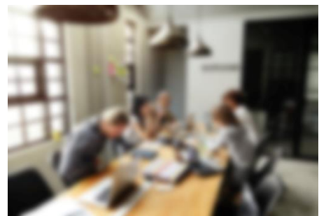
鏡頭異常偵測警報